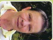
Anke Pabst Schule, Weiterbildung