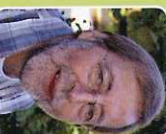
Edgar Müller Gebäude, Bewirtschaftung